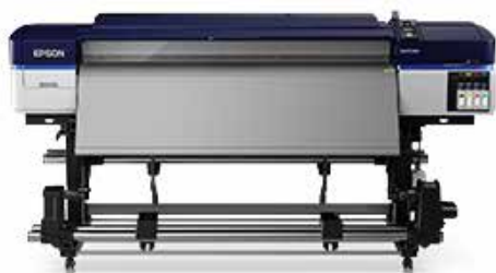
S40600 | entry level 4-color