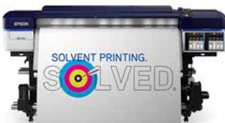
S60600 | production 2 x 4-color