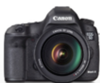
EOS 5D Mark III