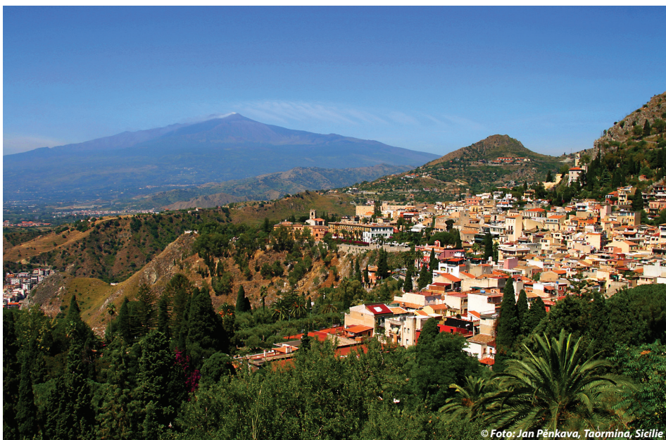
Taormina, Sicílie